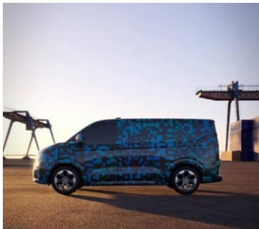
Il maggiore volume di carico del Transporter con passo ruote e tetto normale è stato portato a 5,8 m 3 con un aumento del 10%.

Maggiore volume di carico, carico utile e carico rimorchiabile: grazie all'aumento della lunghezza esterna, della larghezza e del passo, Volkswagen Veicoli Commerciali è riuscita ad aumentare notevolmente il volume di carico della nuova generazione di modelli. Anche i valori relativi